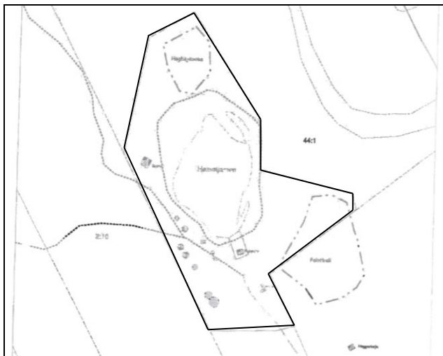
Bild på Kåtabyns tidigare anläggningsarrende.