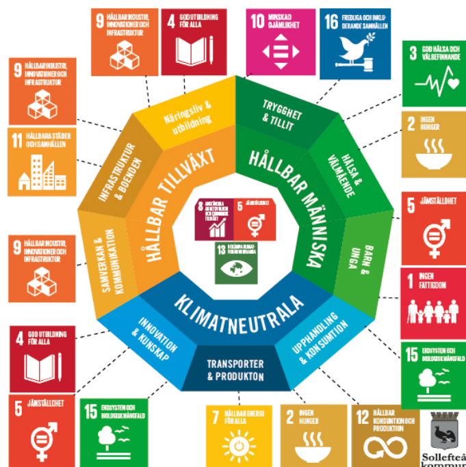
Bild 2. Lokala ambitioner förklarad i modell

I måldokument 2022-2024 har även principer för god ekonomisk hushållning utgått och ersatts med de tre dimensionerna av hållbarhet. För uppfyllande av mål för god ekonomisk hushållning ska antalet uppfyllda indikatorer inom Hållbar människa, Hållbar tillväxt och Klimatneutrala vara minst två till antalet inom varje område och initialt uppgå till minst åtta.